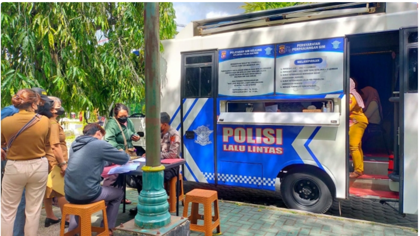
Bus Keliling Dirlantas Polda Kalteng

PALANGKA RAYA - Direktorat Lalu Lintas (Ditlantas) Polda Kalteng berikan pelayanan Surat Ijin Mengemudi (SIM) keliling bagi masyarakat Kota Palangka Raya. Selasa (6/12/2022) Pagi.